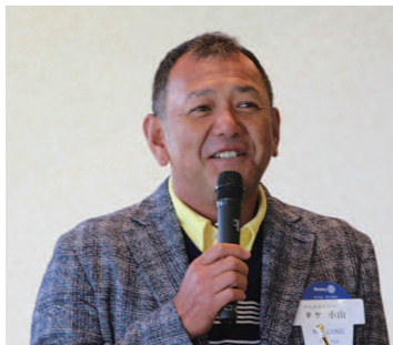
プロゴルファー タケ小山 様

経歴 1989年6月 スポーツ振興フロッグ・グレンリーフリゾートの所属プロとして渡米 1990年 カネディアンエア・インターナショナル 世界10カ国対抗戦、日本男子代表として男子個人4位 1995年 USPGAツアー、ドラール・ライダーオープン出場 1996年10月 フロリダ・オーランドのゴルフチャンネルで解説を始める 1997年 北フロリダPGA・ウィントゥアー賞金王 ※米国ミツアールで通算37勝と米国を中心に数多くの試合に参戦 2001年1月 フロリダ・ゴルフチャンネルの専属解説者として入社 ※欧・米・女子・下部ツアーを含め、年間50試合以上の解説を行う 2006年3月 日本チャレンジャーツアー参戦の為退社 2007年 北海道オープン選手権3位、日本オープンゴルフ選手権出場 2014年10月 日本シニアオープンゴルフ選手権に参戦し、初日6位で予選通過し4日間を完走する 2014年~2016年まで、3年連続、日本シニアオープンゴルフ選手権に出演 2017年 18年の米国での生活にピリオドを打ち、日本をベースに活動を始める 現在は、テレビ・ラジオ・出版などのメディアや、イベント・講演会など様々なジャンルで活動中