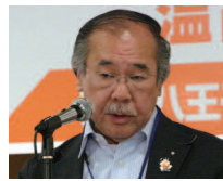
出席報告・ニコニコ発表 山田出席財務副委員長

会員108名中72名出席。出席率72・73%。前回5月10日の出席率78・78%を84・85%に修正します。